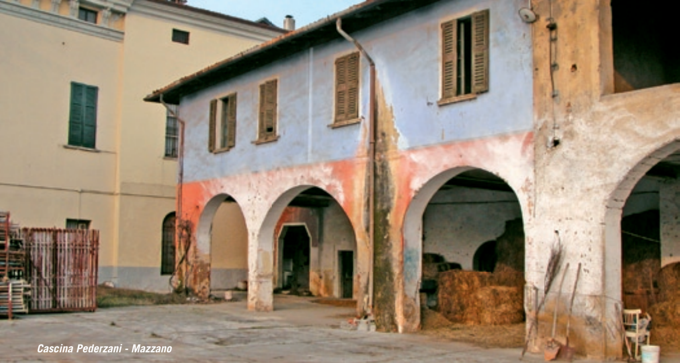
Cascina Pederzani - Mazzano