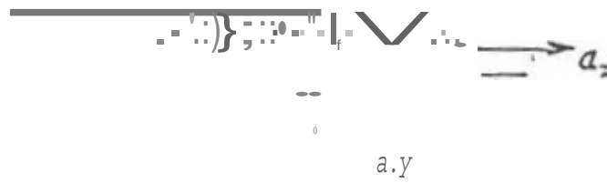
Fig. 1 c